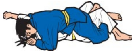
Tate Shiho Gatame (Vierpunktkontrolle längsseits)