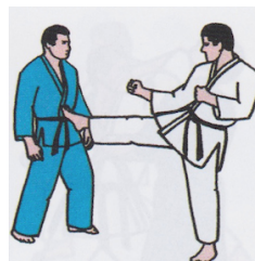
Mae Geri (gerader Fussstoss)