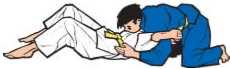
Kami Shiho Gatame (Vierpunktkontrolle von oben)