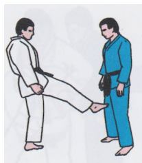
Kin Geri (Fusstritt zwischen die Beine)