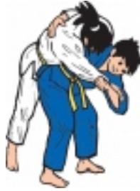
O Goshi (grosse Hüfte)