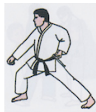
Gedan Barai (Abwehr nach unten)