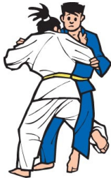
O Uchi Gari (grosse Innensichel)