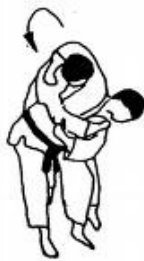
Koshi Guruma (Hüftwurf)