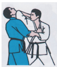
Empi Uchi (Ellenbogenschlag)