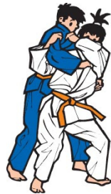
Seoi Nage (Schulterwurf)