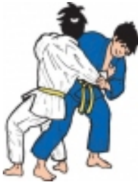
O Soto Gari (grosse Aussensichel)