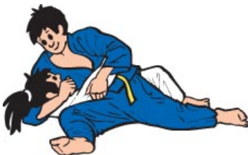
Kesa Gatame (Schärpenkontrolle)