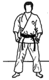
Shizen Tai (Normalstellung)