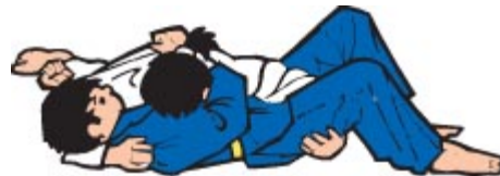
Yoko Shiho Gatame (seitliche Vierpunktkontrolle)