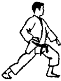
Zenkutsu Dachi (Vorwärtsstellung)