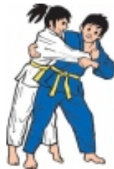
Uki Goshi (flatternde Hüfte)